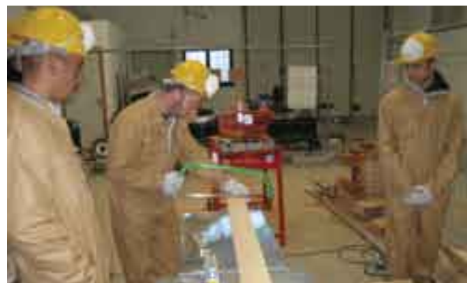
Un'aula della Scuola.

PRINCIPALI PARTENARIATI: Progetto Edifuturo (Marocco) insieme a Scuola Edile Livorno, Scuola Edile Siena. Progetto Youth Start con scambio di allievi con Krefeld (Germania). Progetto Formare costruendo (Argentina) insieme a Kantea e Scuola Edile Lecce. Progetto Formare costruendo (Uruguay) insieme a Kantea, Scuola Edile Lecce, Taranto, Siena. Collaborazione con la Scuola Edile di Point Saint Mairie (Francia) con stagisti francesi a Lucca.