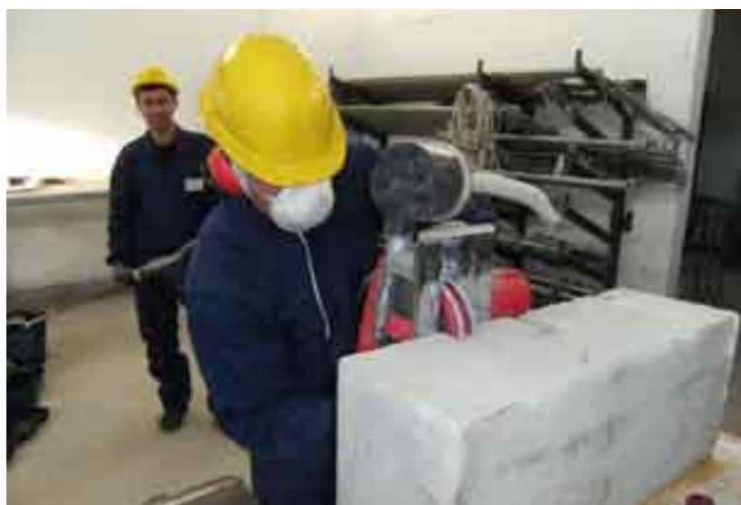
Corso 16ore - Primo ingresso 2009.

La sede attuale della Scuola è stata realizzata a partire dal maggio 1959, data della concessione edilizia, e ha subito nel tempo ampliamenti e miglioramenti.