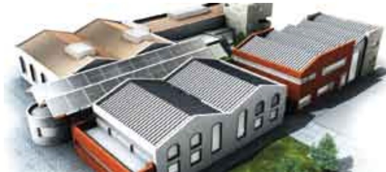
È in programma la costruzione di una nuova sede che ospiterà i tre Enti: Cassa Edile, Scuola Edile e CPT.

La Scuola Edile di Prato è un Organismo Formativo accreditato dalla Regione Toscana ed ha un suo sistema di gestione della qualità certificato dall'ente di certificazione DNV.