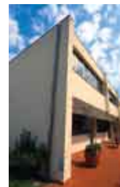
La sede della Scuola Edile.

Nell'aprile del 1978, la comune volontà degli imprenditori edili e delle organizzazioni sindacali di categoria di contribuire in modo determinante a superare i condizionamenti che colpivano duramente il settore edile del territorio, il progressivo invecchiamento dei lavoratori e la difficoltà nel reperire nuove forze lavoro, si concretizzò nella piena autonomia amministrativa ed operativa della Scuola. L'esperienza dei corsi di qualificazione professionale, avviata nel 1975, e protrattasi nei tre anni successivi, giustamente rivisitata, consentì al primo CdA dell'Ente di predisporre un concreto piano di formazione professionale, che venne portato a conoscenza sia delle istituzioni sia delle forze politiche e sindacali. A partire dalla metà degli anni Ottanta la Scuola ha sviluppato una particolare attenzione alle problematiche della prevenzione, realizzando corsi in materia di sicurezza e producendo materiale informativo e formativo. Con l'entrata in vigore del Dec. Lgs. 626/94