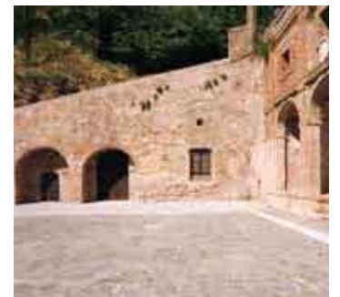
Fonti di Fontebranda, luogo di un cantiere di restauro e recupero della Scuola.

L'Ente è accreditato dalla Regione Toscana per i seguenti ambiti: Formazione dell'obbligo – Post Obbligo / Superiore Formazione Continua – Orientamento; lavora in qualità applicando le procedure previste dalla norma UNI EN ISO 9001-2000.