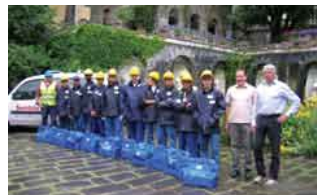
Foto ricordo del gruppo apprendisti del cantiere Limonaie.

La sede della S.F.S. Massa Carrara è ubicata in un palazzo storico del centro cittadino, condiviso, fin dalla sua ristrutturazione, con l'Ente Cassa Edile della Provincia di Massa Carrara. La Scuola ha anche una sede didattica distaccata in Lunigiana, a Filetto di Villafranca Lunigiana, nello storico Convento Fatebenefratelli nell'omonima Piazza.