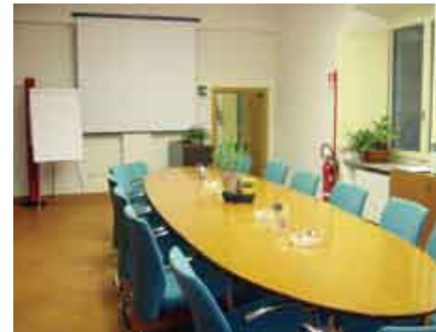
La sala riunioni della Scuola Edile.

La fondazione della Scuola, avvenuta nel 1962, ha voluto imprimere una regola di evoluzione sia tecnica che culturale nell'ambito delle maestranze edili. Nel corso degli anni la preparazione ha sempre seguito l'evolversi delle tecniche più innovative. La Scuola si è sempre relazionata positivamente con il territorio promuovendo corsi sia nella zona di Pistoia che della Val di Nievole e della Montagna Pistoiese. L'offerta formativa si è evoluta seguendo le modifiche normative e l'evoluzione delle tecnologie nel settore edile e oggi la Scuola svolge tutti i compiti a lei attribuiti dal Contratto Collettivo Nazionale di Lavoro. Il maggior impegno è sul fronte della preparazione di Coordinatori alla Sicurezza. La scuola è riconosciuta quale agenzia formativa dalla Regione Toscana.