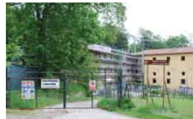
Sede storica "Cantiere Scuola di Villa Demidoff".

allestiti, in convenzione con la Provincia, nel cinquecentesco Parco di Villa Demidoff a Pratolino. Con il lavoro di centinaia di allievi, il CER ha restaurato importanti opere ed edifici storici presenti al suo interno tra cui: la Vasca dell'Appennino, la Locanda o "Vecchia Posta", le Scuderie e la Grotta di Cupido, la Cappella, le Vasche delle Gamberaie e la Grande Voliera, il giardino tra la Villetta e la Fagianeria, il Viale degli Zampilli, il salone della Ex Piaggeria, la Fattoria Nuova e i Padiglioni della Fagianeria e della Limonaia. Tra gli ultimi lavori eseguiti si ricordano il restauro degli affreschi delle stanze di Bianca Cappello nella Villa Medicea di Poggio a Caiano (XVI sec.) e gli affreschi della Chiesa di Santa Maria in Campo a Firenze (prima metà del XVII secolo).