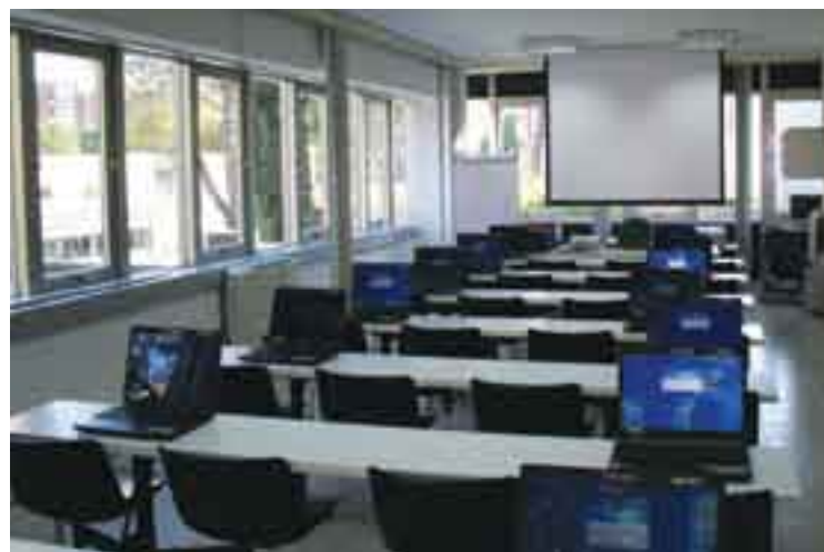
Un'aula della Scuola.

Dal 1982 a tutt'oggi, la sede della Scuola Edile Grossetana è ubicata nello stesso stabile che ospita anche i locali della Cassa Edile. La Scuola ha ottenuto l'accreditamento della Regione Toscana e la certificazione ISO 9001:2008 rilasciata da IMQ.