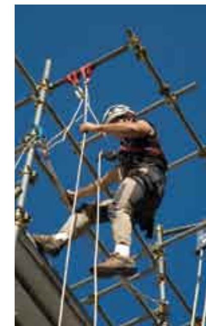
Un giovane allievo durante il corso pontisti.

l'Ente ha potenziato il servizio formativo per tutte quelle figure che sono chiamate a costruire la "cultura della sicurezza" e recentemente è stato realizzato, presso il Centro di Livorno, un laboratorio per le attività formative per gli addetti allo smaltimento, rimozione e bonifica dell'amianto, che si aggiunge ai due cantieri scuola permanenti per gli operatori addetti al montaggio-smontaggio e trasformazione di ponteggi. Oggi le attività della Scuola si rivolgono ai lavoratori che desiderano migliorare le proprie conoscenze, ai cassaintegrati di altri settori che cercano nell'edilizia una nuova collocazione, ai lavoratori che necessitano di una riqualificazione, ai tecnici di cantiere, a coloro che entrano nel settore per la prima volta, agli studenti delle ultime due classi degli Istituti Tecnici per Geometri, ai neo diplomati e laureati in discipline inerenti il comparto, ai cittadini stranieri, ai reclusi delle Case Circondariali. La Scuola nel corso del tempo ha ottenuto per le tematiche sulla sicurezza il Premio delle buone pratiche dall'Amministrazione Provinciale, il Premio per l'ambiente Ulisse dal Comune di Livorno e la certificazione di qualità.